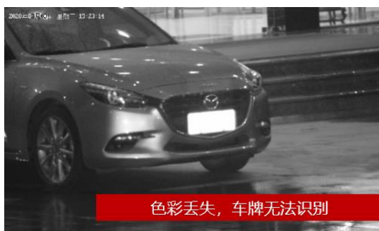
普通摄像机夜晚图像效果