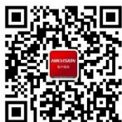
海康威视客户服务

海康威视秉承“专业、厚实、诚信”的经营理念，践行“成就客户、价值为本、诚信务实、追求卓越”的核心价值观，不断创新，不断发展多维感知、人工智能、与大数据技术，为人类的安全和发展开拓新视界。