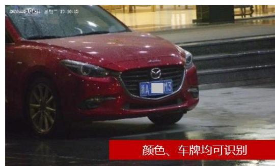
海康臻全彩摄像机夜晚图像效果