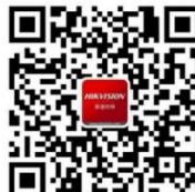
海康威视中小企业服务